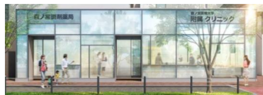
※「大阪ベイクリニック(仮称)」外観イメージ。変更となる可能性があります。

2022年11月に森ノ宮医療大学附属「大阪ベイクリニック(仮称)」(内科・循環器科・整形外科・リウマチ科・リハビリテーション科)が開院します。今回の市民公開講座では、同クリニック医師らを迎え、生活習慣病や認知症、ロコモティブシンドロームなど、身近な病気をわかりやすく解説します。